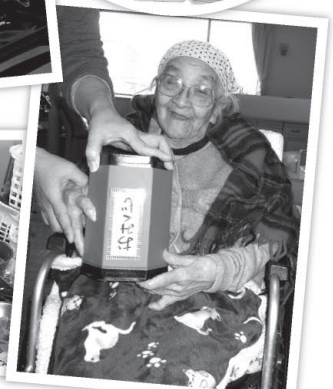
(グループホームCo・Co・甲斐野)